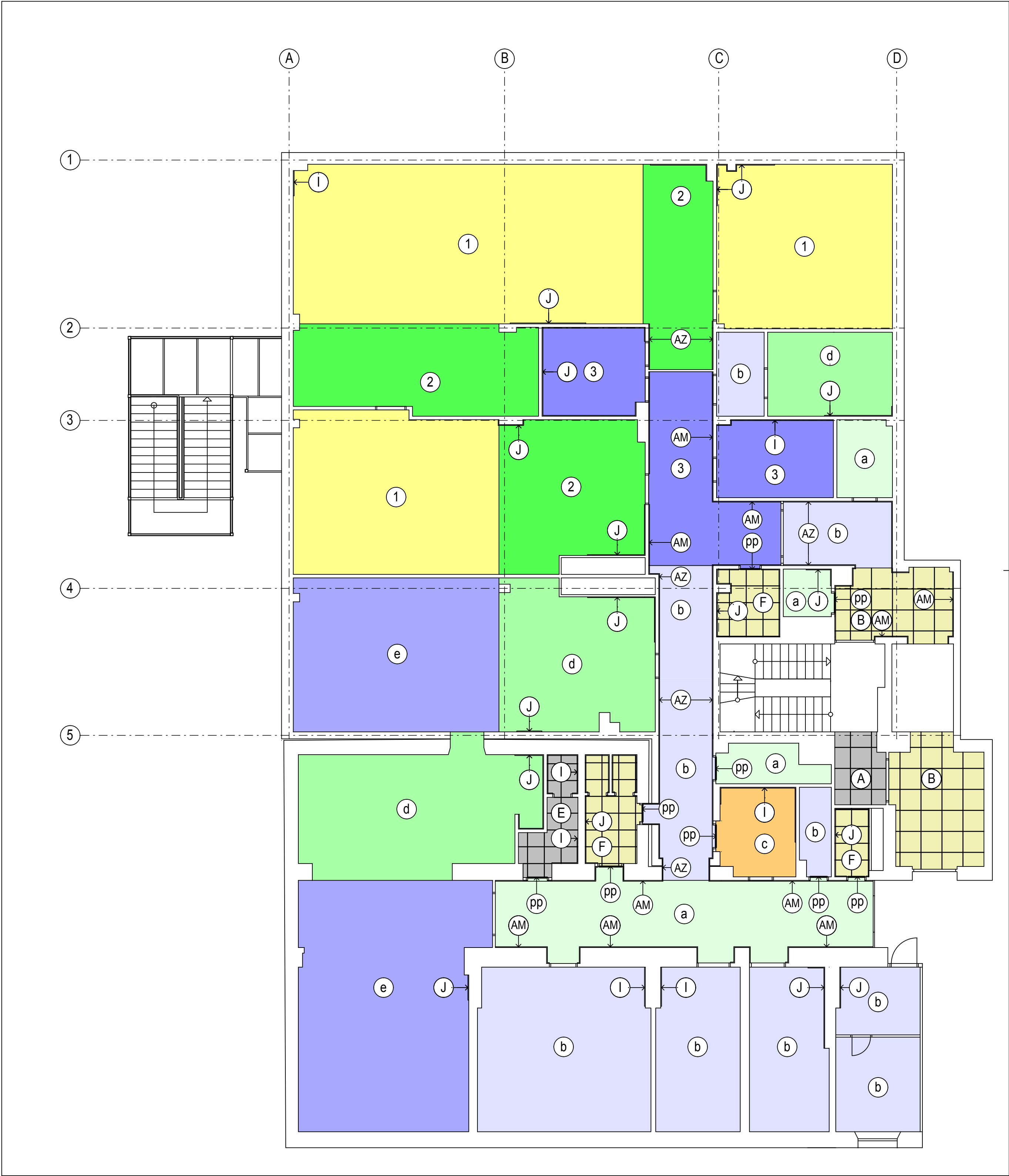
PÔDORYS 3.N.P. - PODLAHY A OBKLADY M1:100